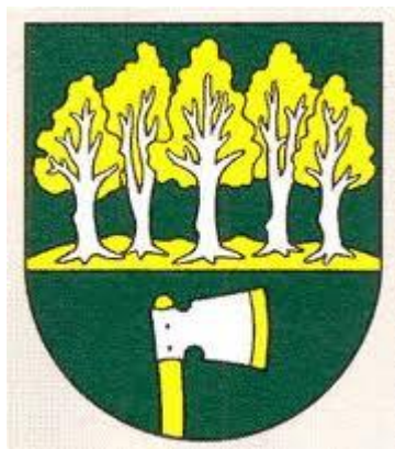
Erb obce Štefanovce